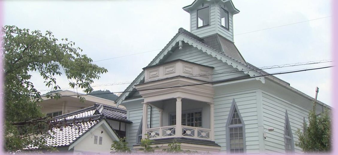
第98回 高梁と新島襄